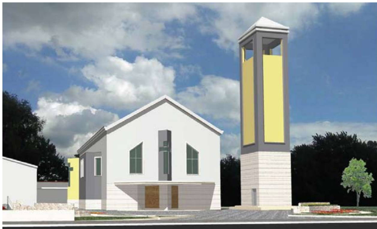
Prijedlog izgleda fasade na novoj crkvi i zvoniku